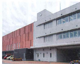
野々市小学校 徒歩13分