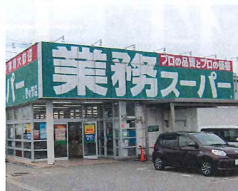
業務用スーパー 徒歩6分