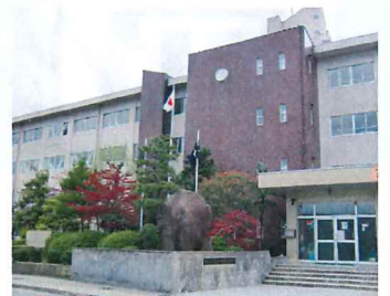
野々市中学校 徒歩2分