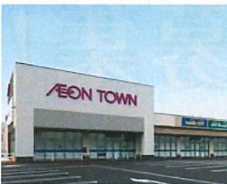
イオンタウン野々市 徒歩5分

借入2,650万円 35年返済 0.35% 2年固定の場合 月々 67,048円 (北国銀行HPより抜粋 最優遇金利)